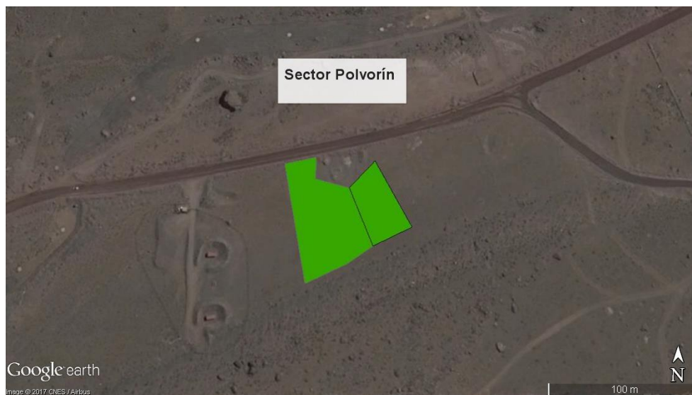
Figura N°1 Ubicación y forma de Sector Polvorín